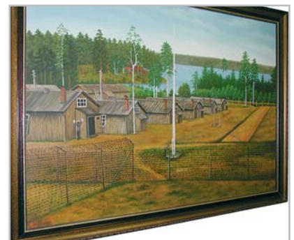
Eräs sotavanki on tallentanut maalauksen oman näkemyksensä Naarajärven sotavankileiristä.

Naarajärven vankilassa suorittavat rangaistustaan henkilöt, joilla on alle vuosi aikaa vapautumiseen. Päivittäin heitä asuu noin 80 ja vuodessa heitä ehtii pistäytymään noin 350.