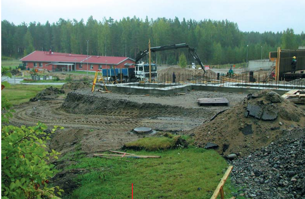
Naarajärven vankilan työmaalla rakennetaan ympäristöjärjestelmän mukaisesti.

Toinen kohde, missä ollaan siirrytty selkeisiin toimenpiteisiin,