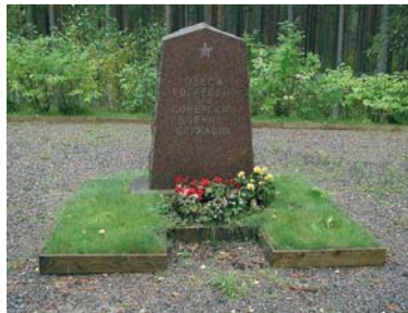
Vanha muistomerkki kertoo 2813 venäläisen kuolleen vankileirillä Naarajärvellä.