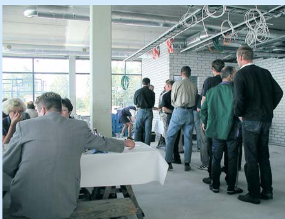
Hernekeittoa jonotettiin Taitotalon hanurimusiikin soidessa.